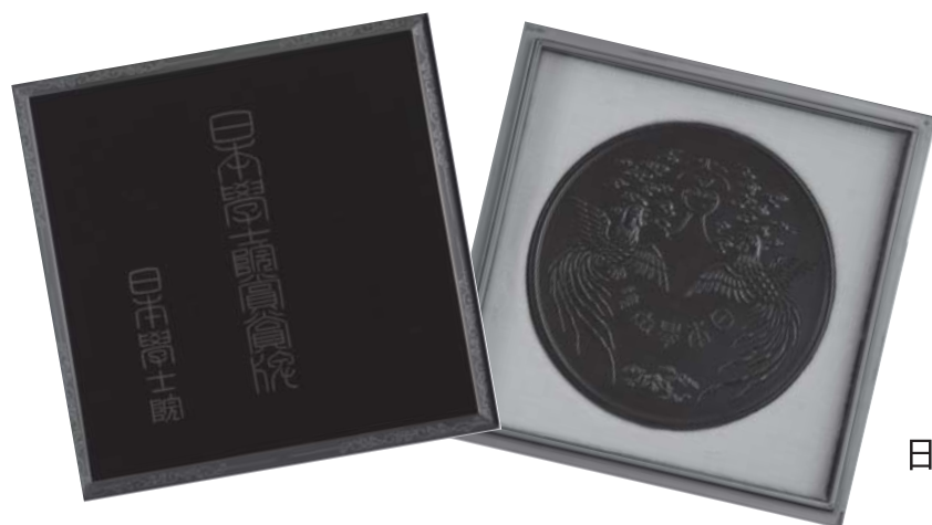
日本学士院賞賞牌

本展ではこれを記念し、授賞制度創設当時の資料、第1回授賞式における挨拶文（草稿）や祝辞等の関係資料、過去の授賞式に関する新聞記事・写真等を展示し、日本学士院の授賞制度の歩みを通して日本の学術がどのように発展してきたかを考えます。